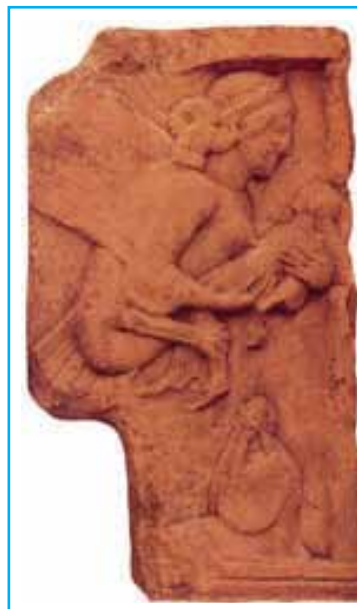
Bassorilievo greco del 400 a.C. custodito al British Museum.

La Lamia, un vampiro che si diceva fosse ghiotto del sangue dei bambini. Rappresentata qui come un demone alato, con il torace di donna e la parte inferiore di uccello, la Lamia veniva accusata di divorare i bambini per vendicarsi della morte del proprio figlio, avvenuta per volere degli dei