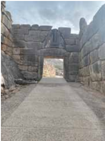
Foto 5 - Micene, Porta dei Leoni

Penso che in nessun altro luogo come in Grecia sia possibile provare un sentimento tanto contrastante di eternità e, insieme, di consapevolezza della nostra precarietà e del nostro limite conoscitivo e comunicativo. Lo dice bene Claudio Magris: “la parola classica trasmette il senso della propria sicurezza e della propria precarietà; insegna che non si riesce a dire tutto e insegna la familiarità con la ricerca della verità, lo scetticismo circa la possibilità di afferrarla e la fede nella capacità di afferrare comunque in questa ricerca qualcosa di essenziale e imperituro”.