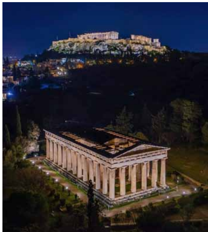
Foto 1 - In primo piano il Tempio di Efesto e sullo sfondo l'Acropoli

La Grecia non offre nei monumenti una testimonianza dia-cronica della sua storia: vi è un oggi, impoetico e pieno di contraddizioni, e un passato di cui restano vestigia da scoprire oltre l'apparenza. Occorre sempre uno scavo: dopo quello dell'archeologo che riporta alla luce un prezioso passato, serve il nostro scavo personale per interpretarlo, interrogarlo e farlo nostro. Il viaggio ci ha offerto perle preziose in tal senso, sconosciute al turismo di massa: dal piccolo Museo del Pireo, con le straordinarie statue bronzee di Apollo, Artemide e Atena realizzate a "cera persa", al tempio arcaico di Atena Aphaia a Egina, solitario e suggestivo custode di antichi miti nella parte alta dell'isola. Pur depre-dato delle statue che ne ornavano i frontoni, il tempio mantiene intatto il suo fascino, riflettendo nella bellezza oltraggiata l'autentica nostalgia di un mondo eroico, fissato per l'eternità nel sorriso arcaico degli antichi guerrieri (Foto 2-3-4).