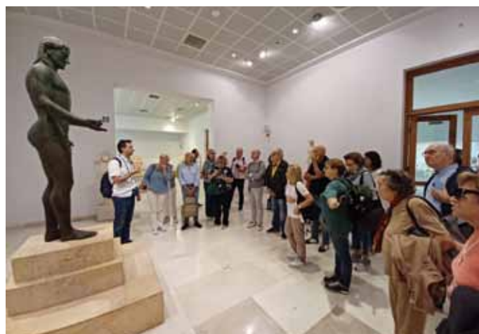
Foto 2 - Apollo al Museo del Pireo

Più noto certamente il sito archeologico di Micene "ricca d'oro": dalla Porta dei Leoni, alla cittadella e al Tesoro di Atreo, come su una scena teatrale, ecco snodarsi la cupa vicenda di sangue degli Atridi e "la tua reggia, Agamennone, / è covo di