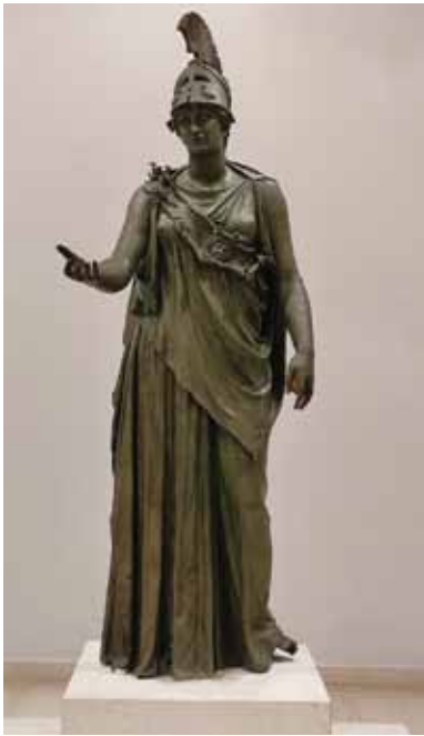
Foto 3 - Statua di Atena al Museo del Pireo