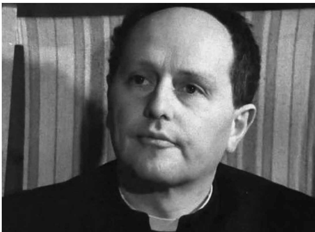
Don Lorenzo Milani