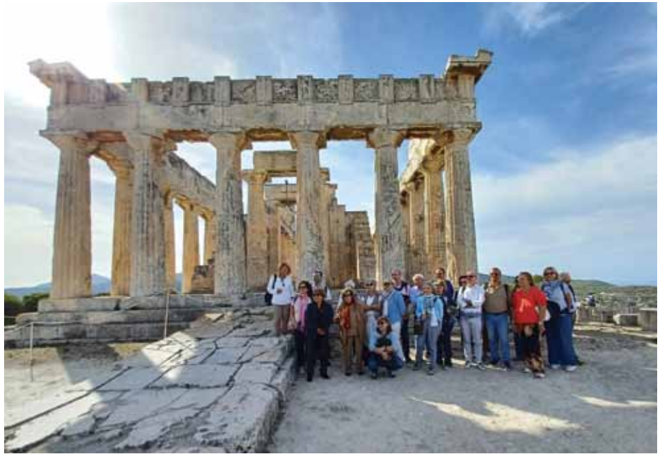
Foto 4 - Tempio di Aphaia a Egina

briganti sotto il monte / Zara di sasso non scalfito / da radici a strapiombo su burroni sghembi” (S. Quasimodo) (Foto 5). Con un linguaggio evocativo le rovine testimoniano un passato che continua a parlare al nostro presente. Culmine del pathos la tappa a Salamina, luogo della battaglia navale che