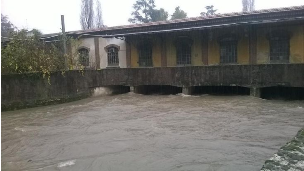
(L'Olona a Castellanza alle 13 di lunedì 10 novembre)

La Protezione Civile è in allerta su tutto il territorio e colonne di mezzi, già questa mattina, si dirigevano dal sud verso il nord della provincia, dove si temono i disastri maggiori. Sorvegliata speciale la zona del Cucco (Montegrino) e dei Premaggi (Germognaga) dove il Margorabbia potrebbe esondare nuovamente e allagare abitazioni e aziende, come già accaduto nella notte tra mercoledì e giovedì scorso ( leggi qui ).