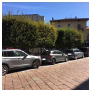
piazza XX Settembre