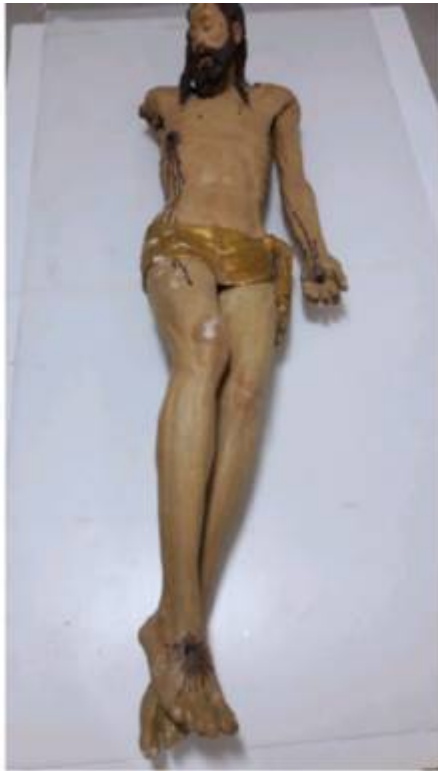
Prima del restauro