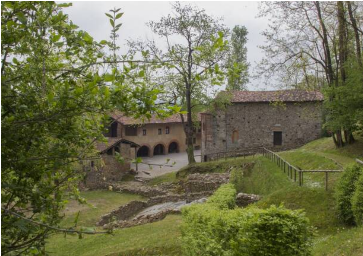
Il monastero di Torba

Proprio con questo obiettivo, sempre più gli studenti delle scuole del territorio sono stati coinvolti e motivati a divulgare le ricchezze di questi luoghi, con lo scopo di far crescere l'interesse verso il bene Unesco.