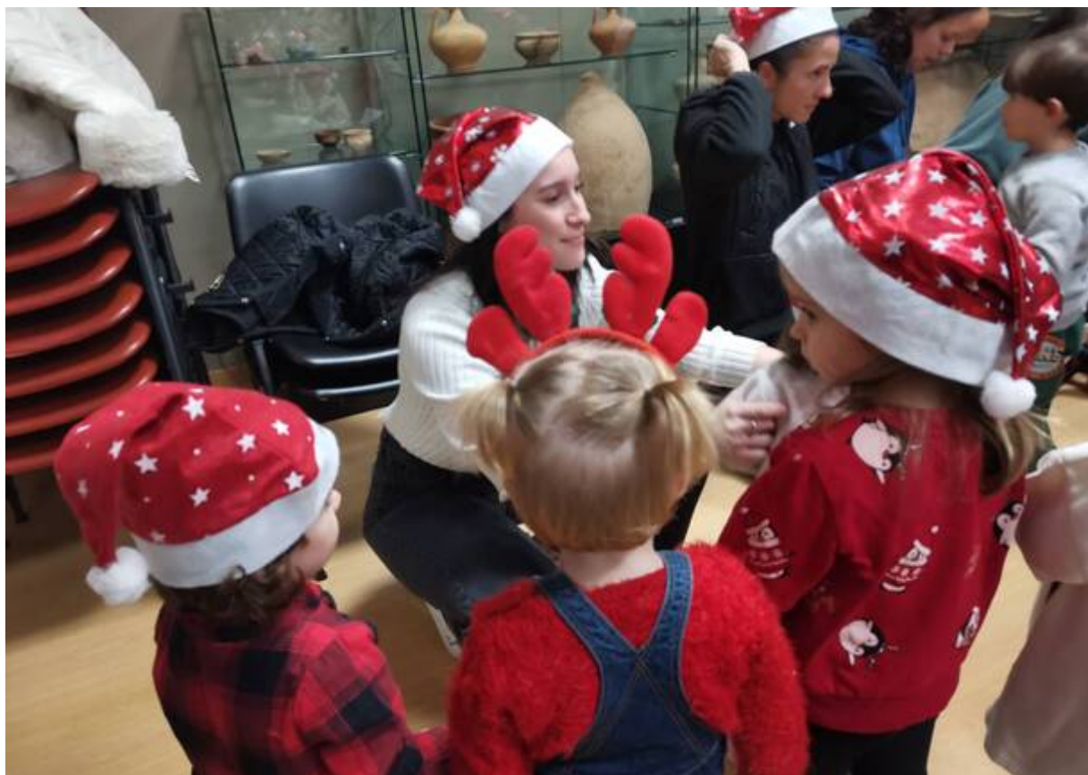
Alcuni bambini prima della loro esibizione

Tornando alla giornata inaugurale, oltre all'apertura della mostra in municipio, sono svariati i momenti che hanno rallegrato le tante persone intervenute.